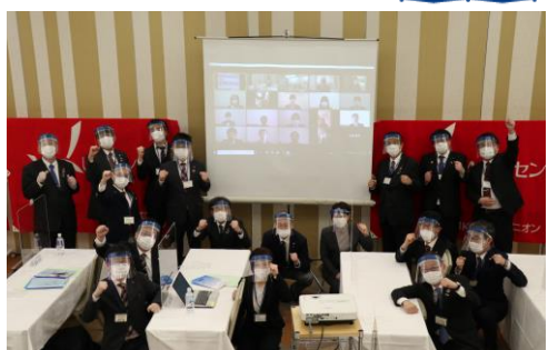
大会にWEBで参加した中央執行委員を囲んで